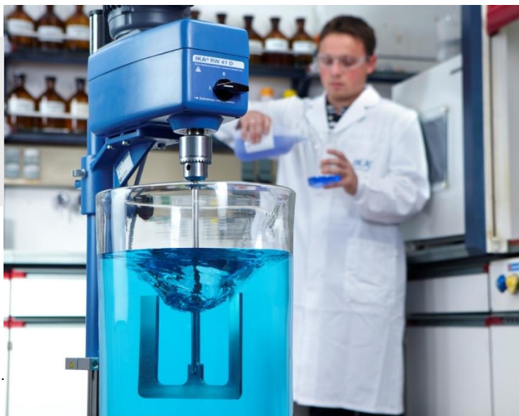
Опытная лаборатория IKA®.

Все металлические части мешалки, соприкасающиеся с продуктом, изготовлены из нержавеющей и стойкой к кислотам стали. Специальный защитный кожух предотвращает возможные травмы при соприкосновении с вращающимся валом и элементами насадки. IKA® поставляет также подходящие штативы во взрывозащищенном исполнении и принадлежности для крепления перемешивающих устройств.